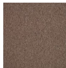
Coffee Break 71761