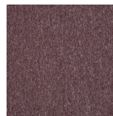
Rose Trellis 71830